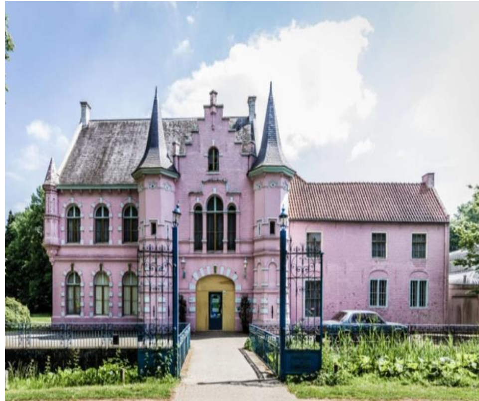
Kasteel d'Oultremont (vm. Land van Ooit).