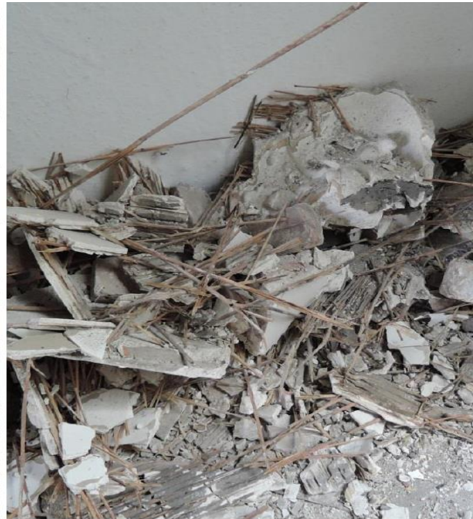
Voorhuis, bel-etage, achterkamer, schouw en stucplafondrestanten in 2017